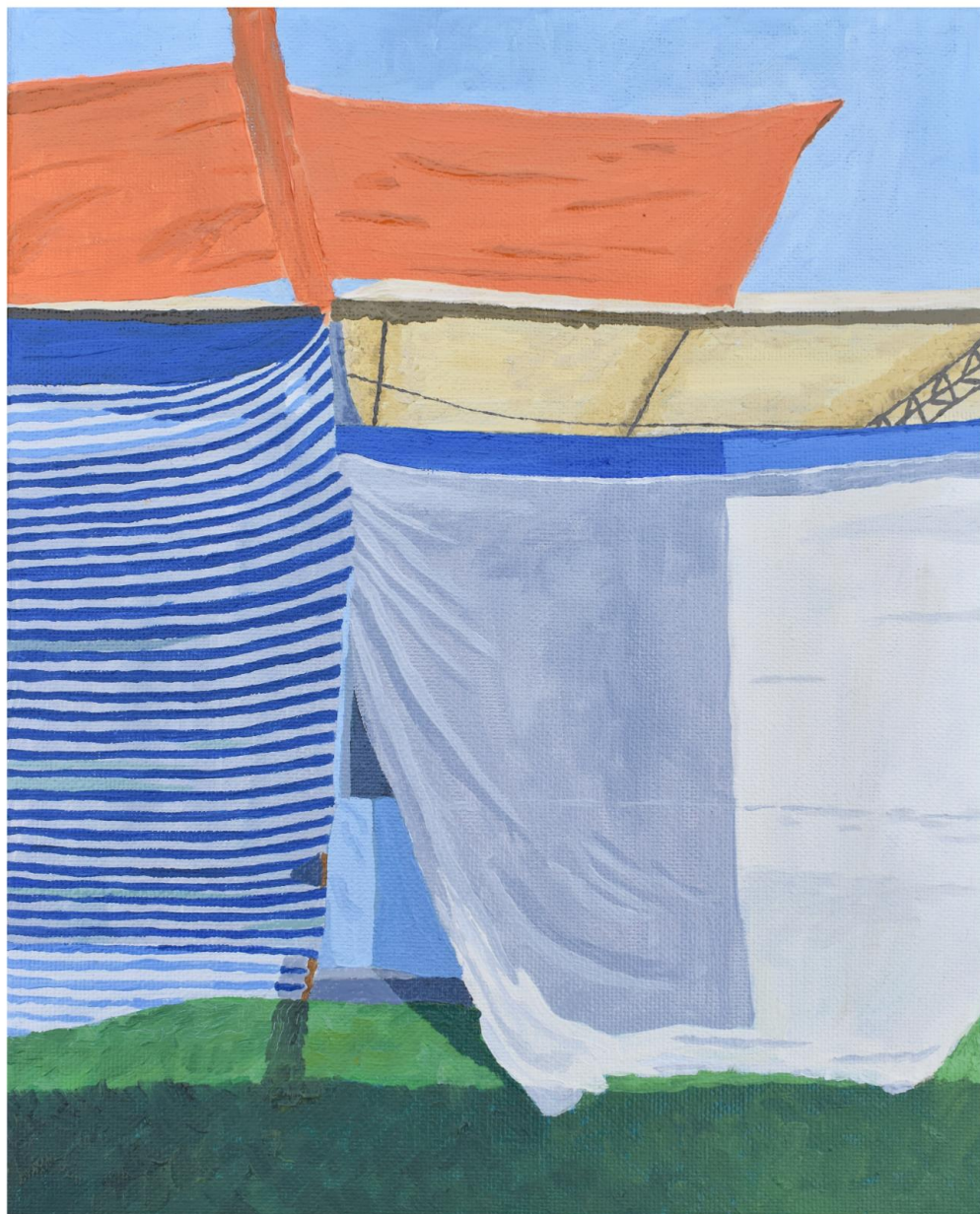
Amalia Cabezas, "Tela sobre Tela", óleo sobre tela, 27x22 cm.

"Cuando una mujer asumió la dirección de un doctorado. Me llamó para integrarme al claustro.