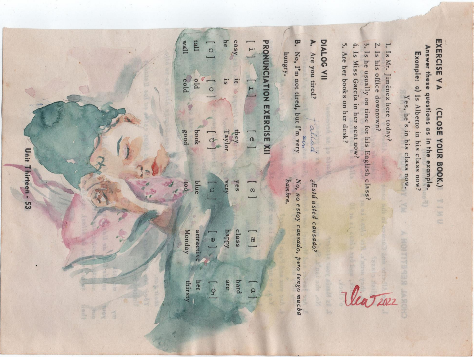
Victoria Moreau Rojas, "Ternura (en la sociedad del cansancio), acuarela sobre papel de libro, 15 x 21,5 cm.