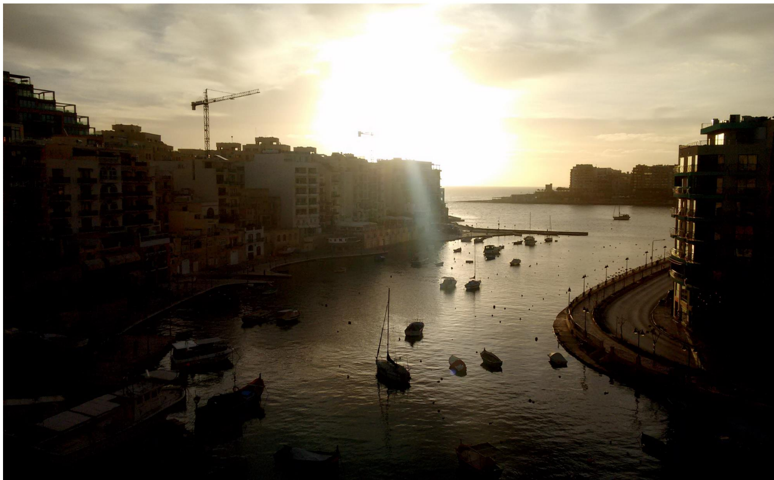
Denisse Sepúlveda, "Malta", Fotografía digital.

"En la línea de investigación donde trabajo se estaba empezando a armar un paper colectivo importante, pero yo podría participar solo en un par de reuniones, porque saldría a prenatal.