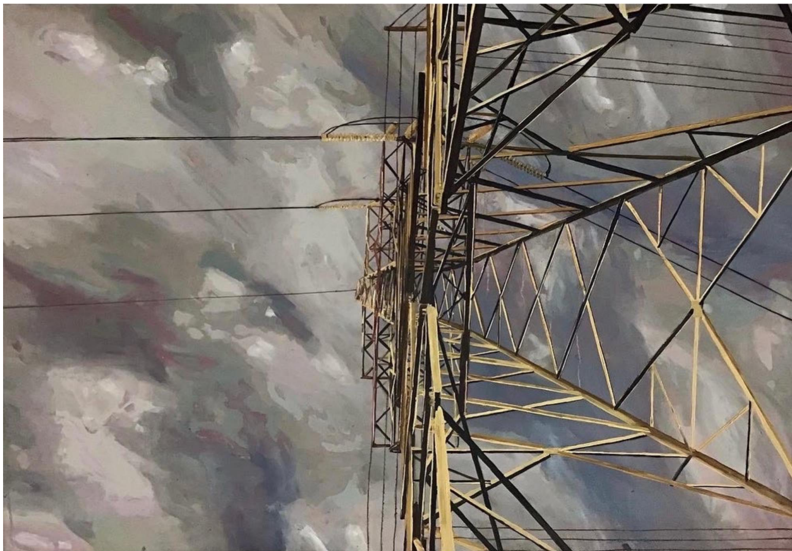
Mara Santibáñez, "Torre del Bato", óleo sobre tela, 106X74cm.

"En una mesa de un congreso internacional había una académica con su guagua recién nacida y a ella le tocaba presentar al final de todos. La académica estaba sola con su guagua, no tenía colegas conocidos. En medio de las otras presentaciones, la guagua comenzó a llorar y alguien comenzó a quejarse del llanto de la guagua, le pidió a la colega que se fuera de la mesa y varias personas de esa mesa defendieron a la colega y reprochaban el comentario no empático, mientras que otras personas se ofrecieron a cuidar a la guagua mientras la colega presentaba."