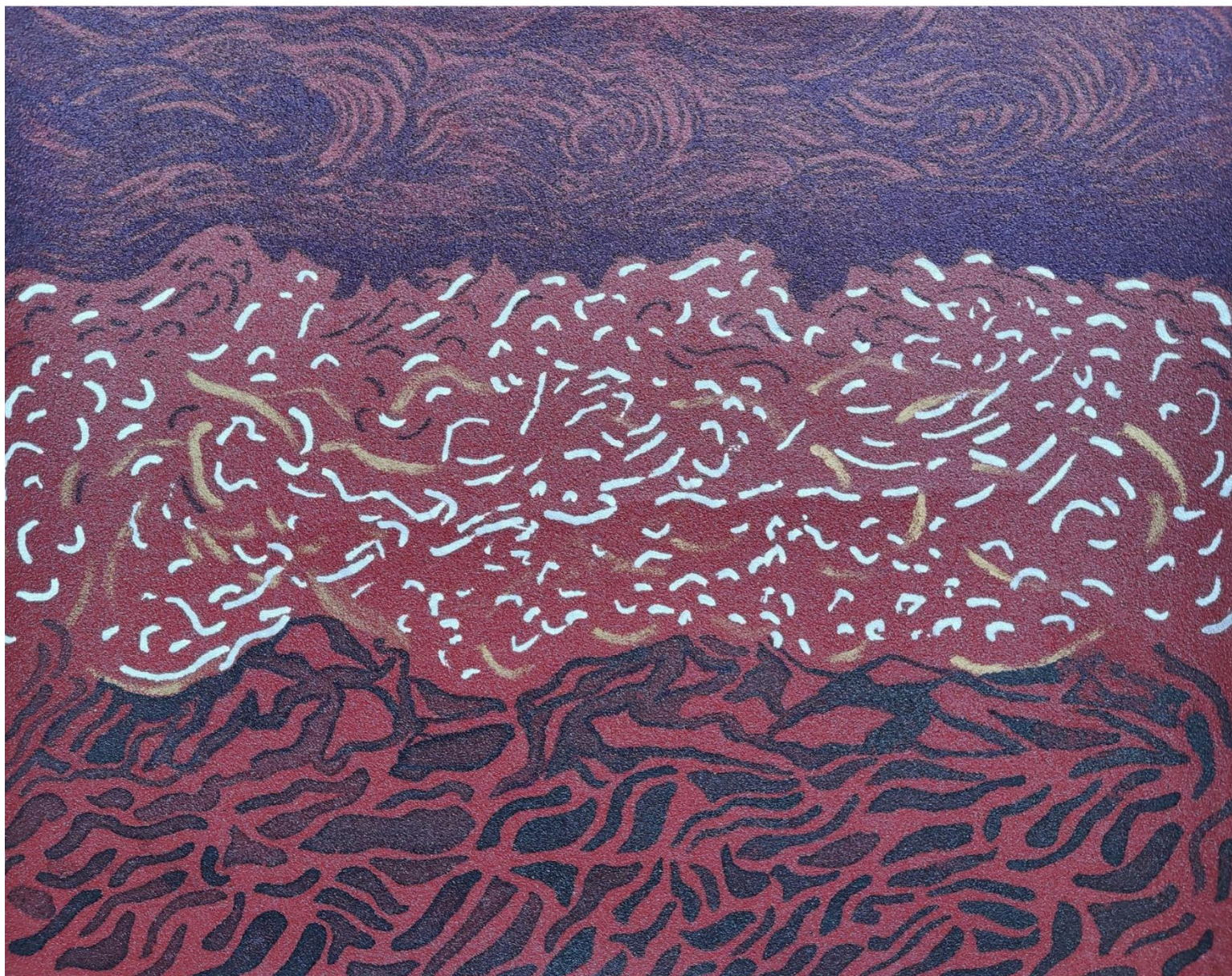
Daniela Banderas, "Paisajes Rasposos XII", tinta y acrílico sobre papel de lija, 22,6X28cm.

"Cuando el papá de mi hija dejó de pagar pensión, me subieron el sueldo, pese a que no me tocaba reajuste hasta en dos años más. Las únicas que sabían eran la directora de departamento y la presidenta de la comisión de jerarquización. Nunca supe cuál de las dos solicitó mi aumento."